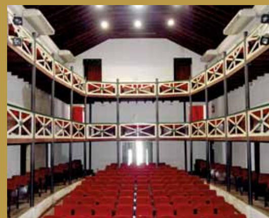
>> Teatro da Ribeira dos Icó

mais antiga edificação de Icó, que está completando 300 anos. Ao lado, a Casa de Câmara e Cadeia, concluída em 1744, com suas paredes de um metro e meio de espessura e chave de quase “meio quilo”, contam os historiadores. Uma verdadeira fortaleza, que até o início do século XX era o resíduo mais seguro do Estado. Hoje, o prédio está sendo recuperado, e vai sediar um museu, uma biblioteca e um centro de informática.