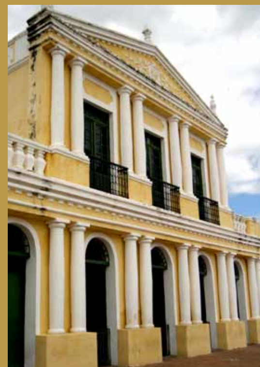
>> Fachada do Teatro Ribeira dos Icó