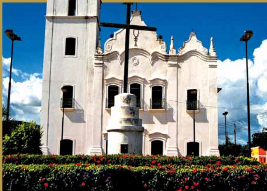
>> Igreja do Rosário

tado o Núcleo de Música, que atende crianças e jovens e tem como meta fortalecer bandas locais e estimular a memória da música local.