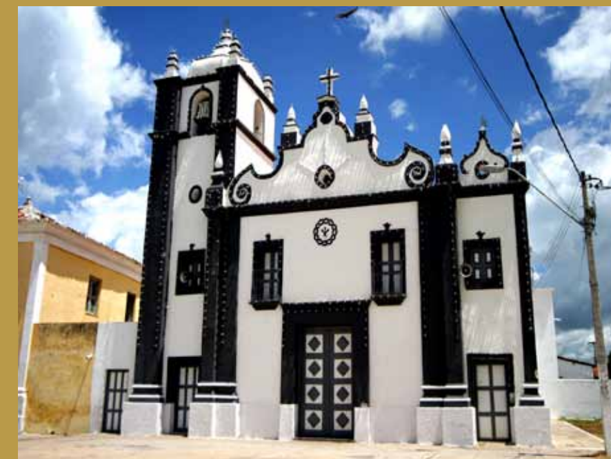
>> Igreja do Bonfim