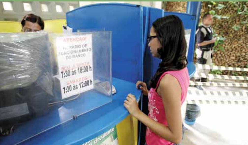
>> Recebimento de convênios (água, luz, telefone) pode ser feito no Banco Palmas