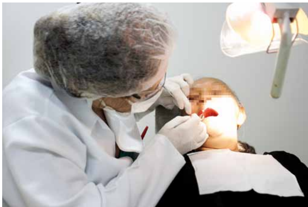
>> Tratamentos odontológicos para os servidores

latos de pesquisa que mostram uma associação entre doenças periodontais e problemas cardiovasculares, como AVCs e doenças de artérias periféricas. “Outro problema associado às infecções de baixo grau diz respeito ao nascimento de bebês prematuros ou de baixo peso”, acrescenta.