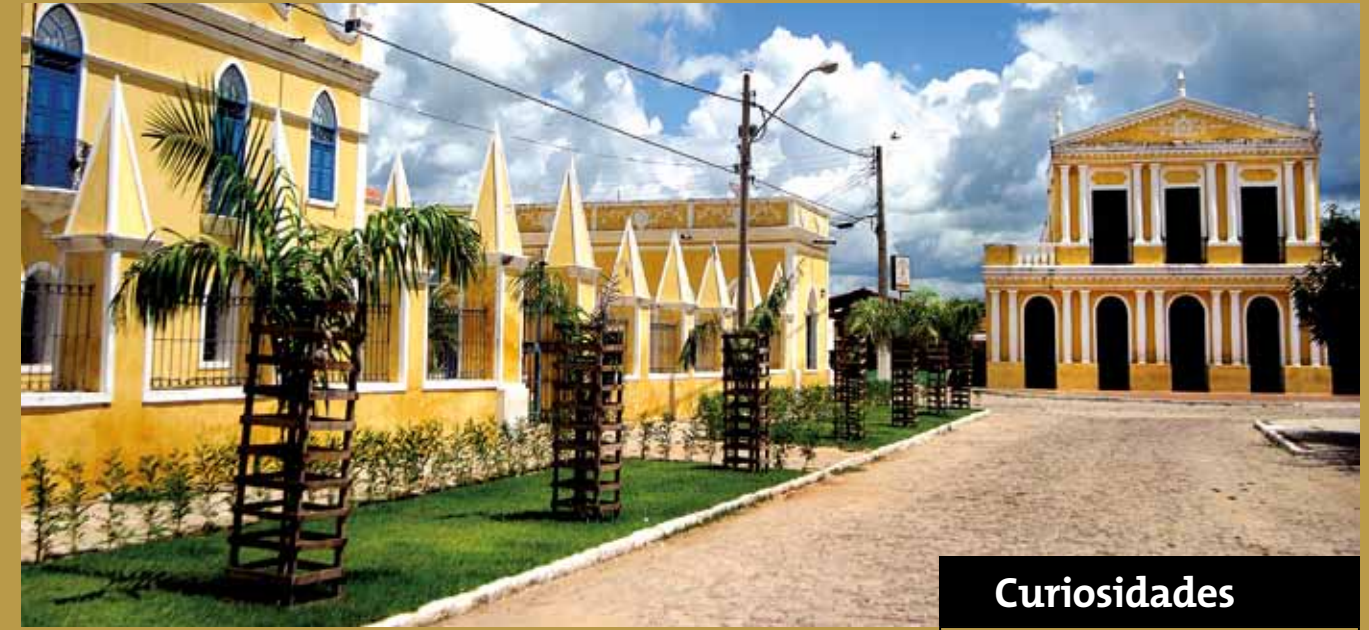
>> Câmara Municipal, Cadeia Pública e Teatro