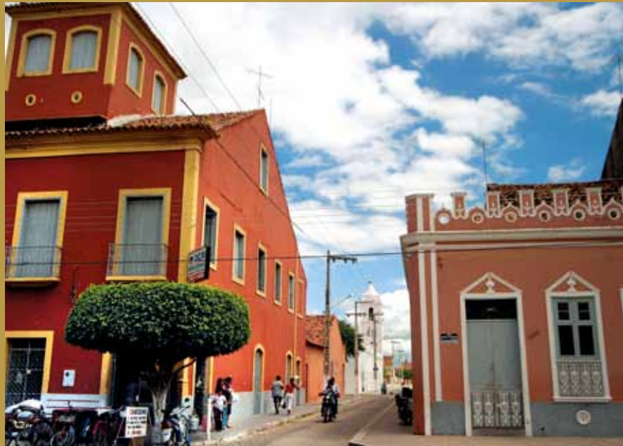
>> Casarões de Icó