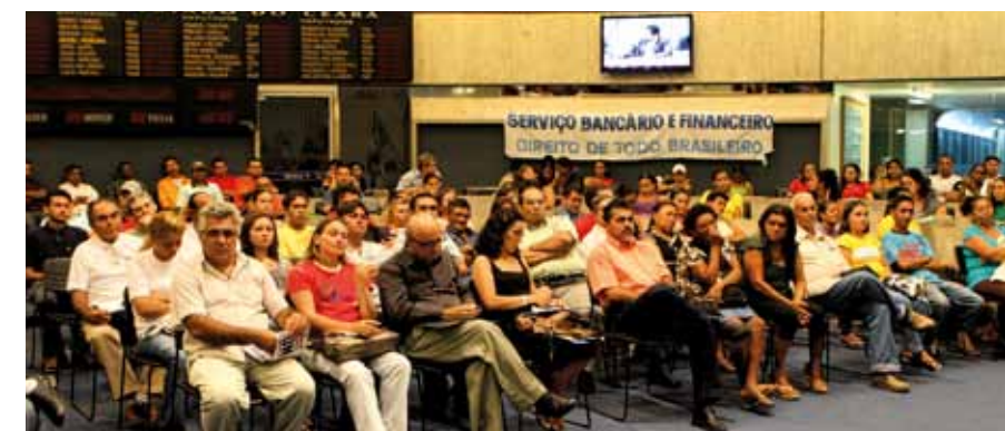
>> Representantes de bancos comunitários participaram da audiência

a economia solidária tem como meta a igualdade, com produção, consumo e comércio justos e ressaltou que “no Brasil, a economia solidária tem crescido de forma rápida, como resposta ao abandono do campo e o desemprego”.