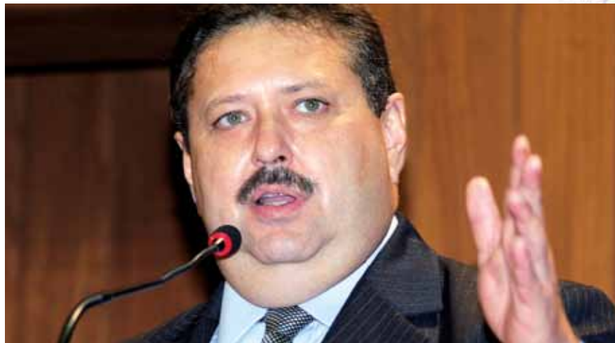
>> Deputado Domingos Filho (PMDB), presidente da Assembleia Legislativa do Ceará

Domingos fez questão de destacar que não existe nenhuma disputa entre Ceará e Piauí. “Muito pelo contrário, são estados irmãos que têm relacionamento excelente.