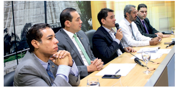
COMISSÃO PÁGINA 4

Presidentes dos Parlamentos nordestinos criam fórum de mobilização em defesa dos interesses da região