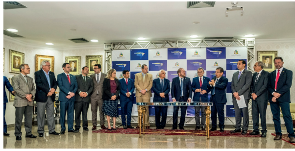
PARLANORDESTE PÁGINA 2

Deputados do Nordeste entregam ao presidente do Senado a Carta de São Luís com pleitos da região