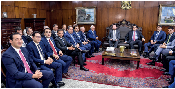
COMITIVA PÁGINA 2 E 3

Deputados do Nordeste entregam ao presidente do Senado a Carta de São Luís com pleitos da região