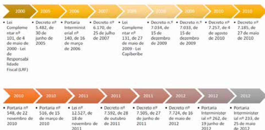
Figura 1- Legislação brasileira relativa à Transparência Pública.

Após a LRF, um conjunto de leis, decretos e portarias foi criado para regular a temática da transparência no Brasil, culminando na aprovação da Lei de Acesso à Informação (Lei nº 12.527/2011) e legislação decorrente (Figura 1). A referida lei regulamenta, entre outros, o inciso XXXIII do artigo 5º da Carta Magna, tendo em vista a eficácia limitada da norma constitucional, necessitando de normatividade ulterior. Assim, o texto constitucional define o “direito a receber dos órgãos públicos informações de seu interesse particular, ou de interesse coletivo ou geral”, mas deixa para definir à posteriori a forma, os prazos e instrumentos relativos ao direito estabelecido.