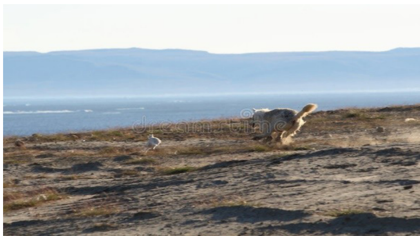
Figura 05 – Caçada

Por outro lado, no pensamento de Buda, "o perdão é um presente para quem perdoa". Essa é uma perspectiva extremamente relevante de mostrar que quem perdoa se liberta do encargo, do desejo de vingança e do peso da consciência, podendo seguir seu caminho diferente do caminho da pessoa que odiada. Quando um lobo persegue um coelho, é o coelho que determina para onde vai fugir e o lobo corre atrás. Se o coelho cair em um precipício, provavelmente o lobo cairá também.