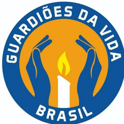
Figura 02 – Símbolo do Guardiões da Vida Brasil