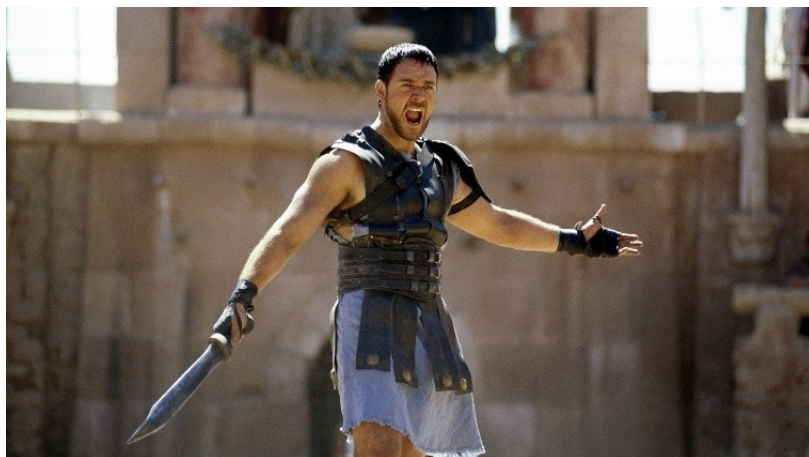
Figura 03 – Guerreiro antigo de saia. (Ator Russell Crowe, em "O Gladiador")

No filme, "O Gladiador", observa-se o general Maximus (Russell Crowe) usando saia e demonstrando um padrão de comportamento que é entendido por muitos como másculo.