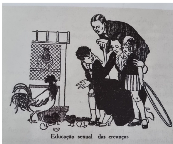
Figura 04 – Família do século XX ensina sobre educação sexual para crianças.