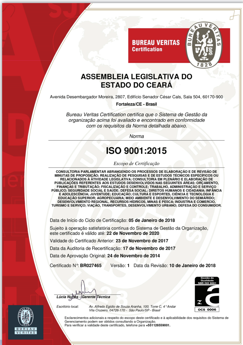
Figura 2: certificado ISO 9001:2015.