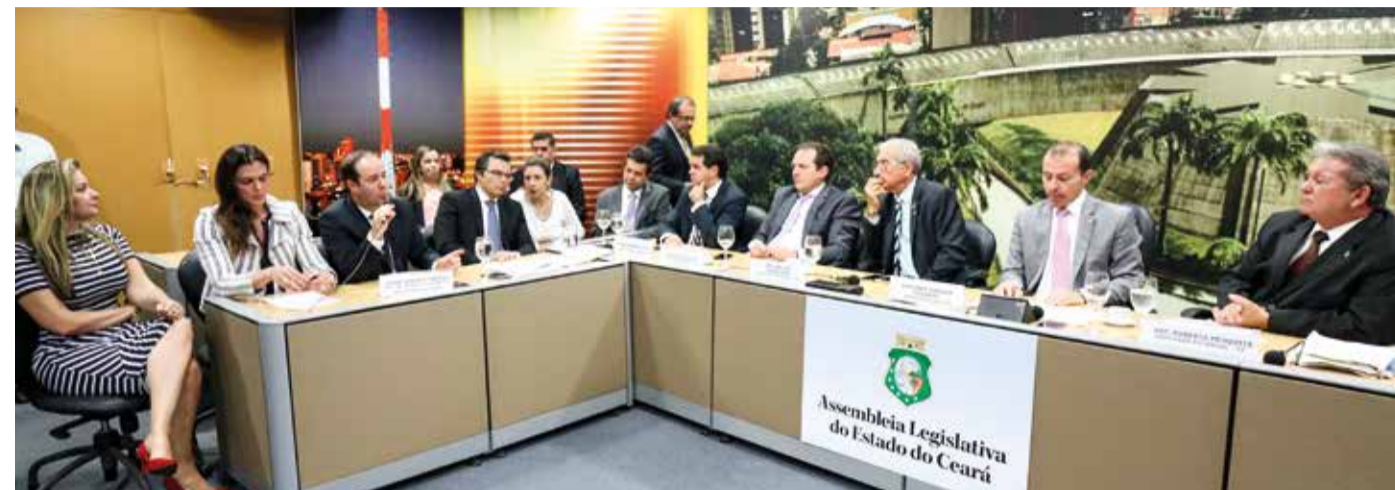
Audiência pública no complexo das Comissões com representantes do CIPP, governo estadual e Procuradoria Geral do Estado