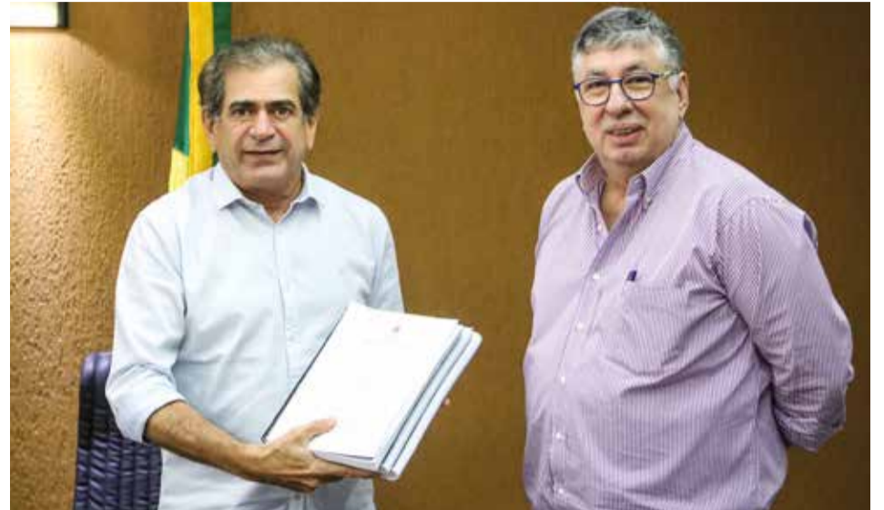
Presidente Zezinho Albuquerque recebe do secretário Maia Júnior o projeto da LOA-2019

O presidente da Assembleia Legislativa do Ceará destacou que o secretário de Planejamento tem colaborado para o sucesso do Estado no equilíbrio das finanças públicas, em comparação a outros estados. “Temos o prazer de receber aqui o secretário Maia Júnior, que vem nos entregar o orçamento para 2019. Vamos encaminhar a matéria para a leitura no Plenário e discussão na Comissão de Orçamento, Finanças e Tributação, para que seja votado o mais rápido possível”, afirmou.