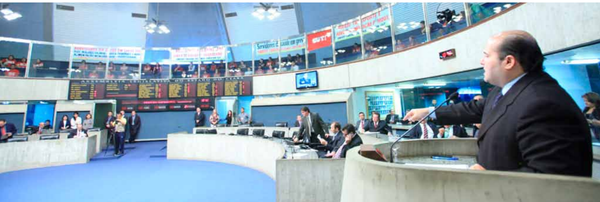
>>Presidente Roberto Cláudio apresenta balanço na sessão de encerramento do primeiro semestre.

Roberto Cláudio reitera compromisso com a construção de um Legislativo forte