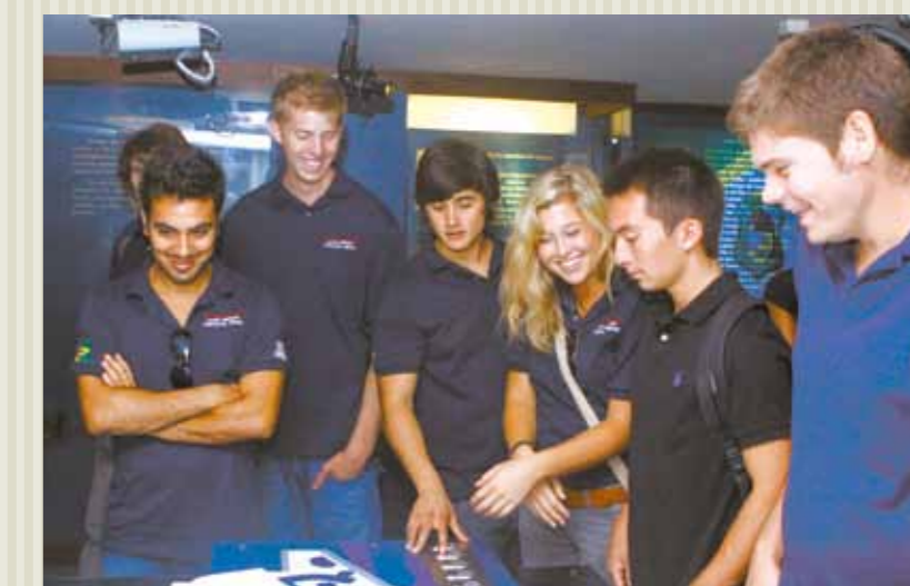
>> Visita dos alunos da Universidade do Arizona (EUA) ao Memorial da Assembleia.