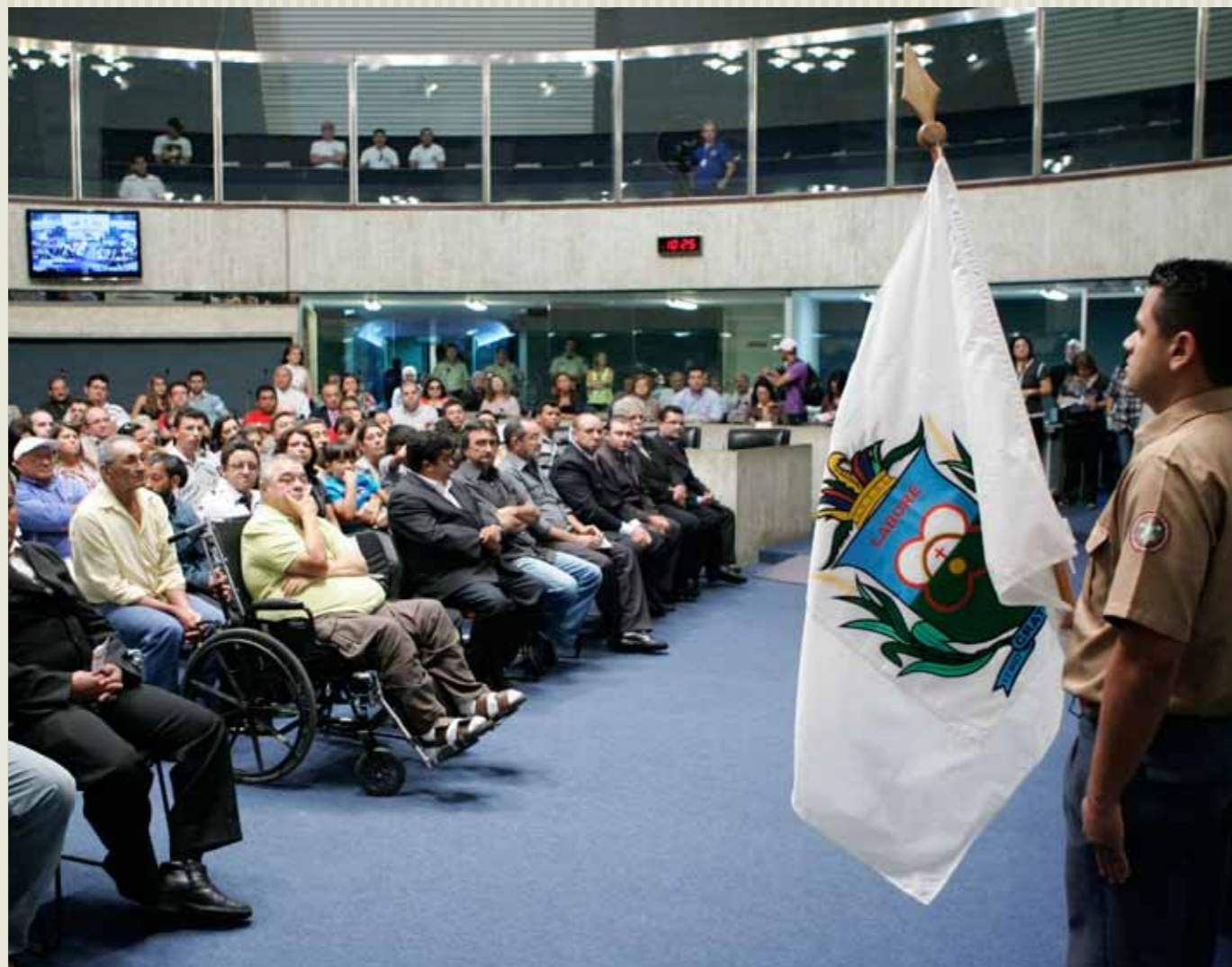
>> Vista do Plenário 13 de Maio durante a IV Jornada Municipalista

A Assembleia Legislativa realizou, em julho, diversos eventos no Plenário 13 de Maio, dentre eles, a IV Jornada Municipalista, a última do primeiro semestre, evento promovido pela Presidência da Casa para homenagear as cidades cearenses cujas datas de emancipação ocorreram naquele mês. No dia 13, foi realizada sessão solene para comemorar os 21 anos do ECA (Estatuto da Criança e do Adolescente). A Casa sediou ainda audiências públicas e recebeu visitas, como a que foi feita ao Memorial por estudantes da Universidade do Arizona (EUA).