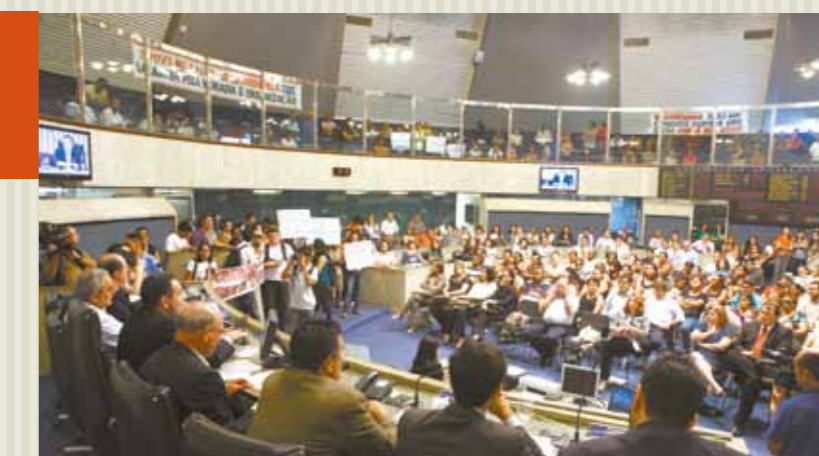
>> Audiência Pública sobre o VLT (Veículo Leve sobre Trilhos) Parangaba-Mucuripe.