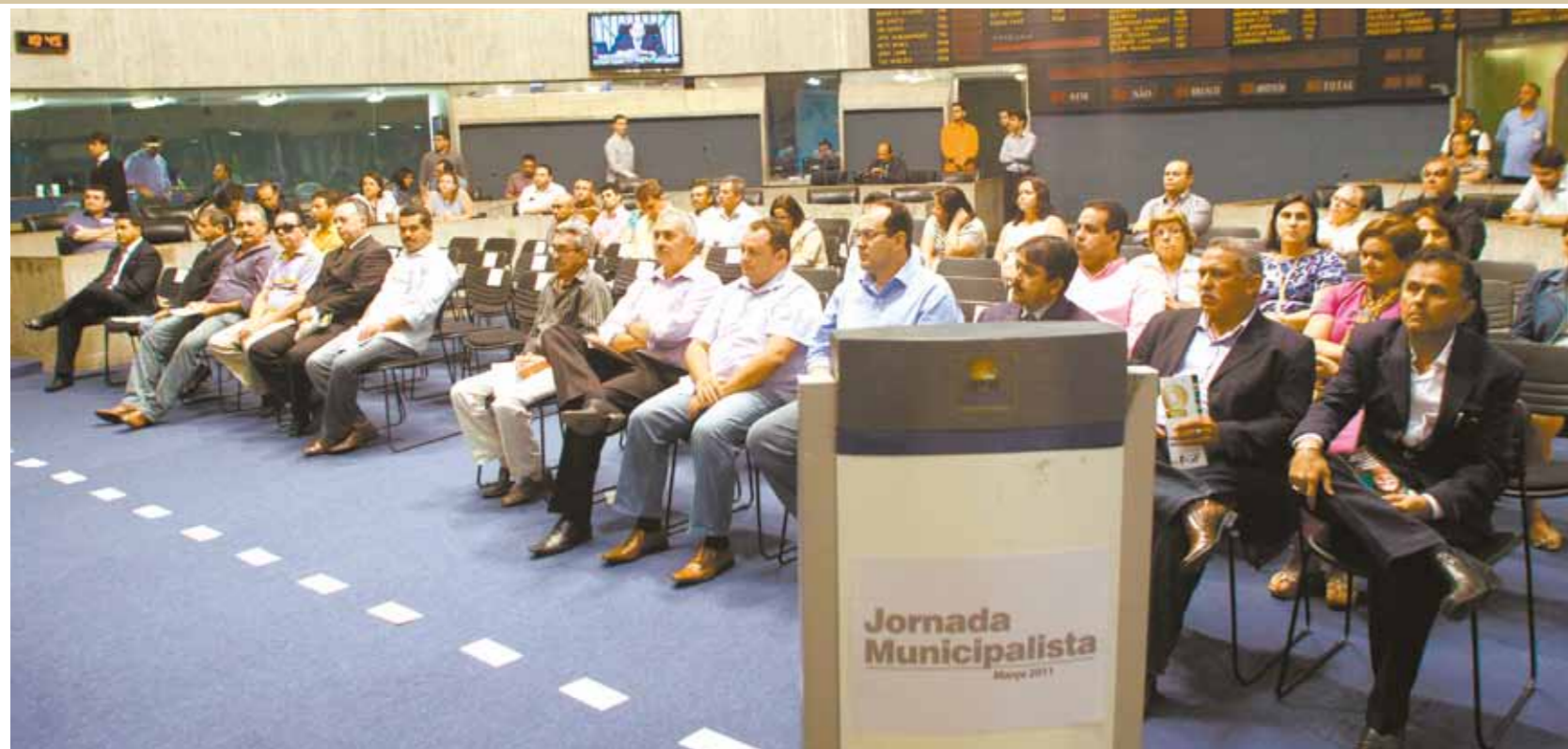
>>A Jornada Municipalista foi realizada no Plenário 13 de Maio