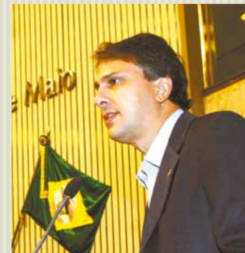
>> Secretário estadual das Cidades, Camilo Santana, fala aos prefeitos durante a Jornada Municipalista.