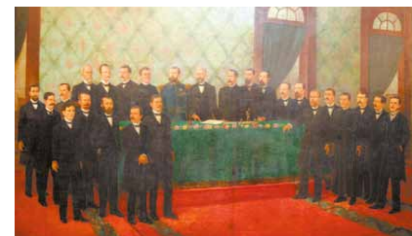
>> Pintura mostrando a primeira reunião da Assembleia do Ceará após a Proclamação da República, em 1891.

Desde 1835 até hoje, a Assembleia Legislativa reuniu-se em quatro sedes. A primeira, localizada na antiga Praça do Conselho, atual Praça da Sé, ocupada de 1835 a 1856; a segunda, de 1856 a 1871, no antigo prédio da Intendência Municipal, localizado à Praça do Ferreira; a terceira funcionou de 1871 a 1977 no Palácio Senador Alencar, inaugurado em 4 de julho de 1871 a 1977 no Palácio Senador Alencar, inaugurado em 4 de julho de 1871; a quarta e atual sede, desde 1977, é o Palácio Adauto Bezerra".