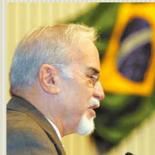
>> Professor Roberto DaMatta durante a palestra sobre seu livro 'Fê em Deus, Pê na Tábua'.