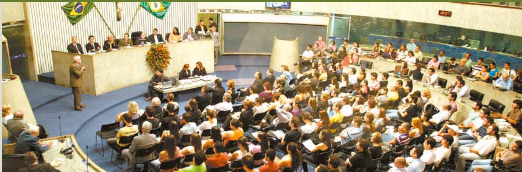
>> Vista do Plenário 13 de Maio durante o Fórum Vida, Mobilidade e Felicidade Urbana.