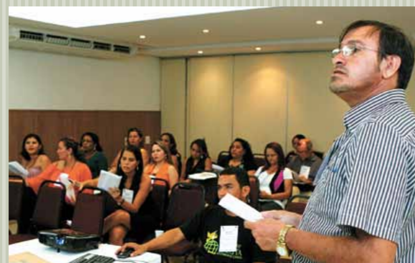
Representantes de entidades e instituições discutem problema das drogas na oficina do Pacto pela Vida.