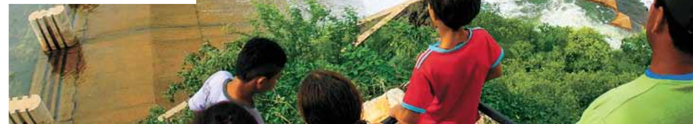
&gt;&gt; Açude de Orós

Cadernos contêm estratégias específicas para impulsionar o desenvolvimento de cada região.