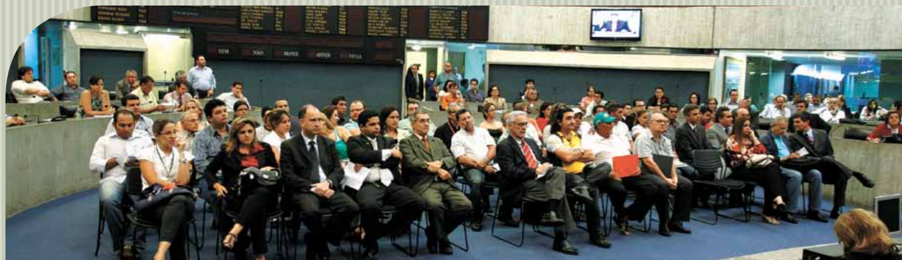
Vista do Plenário 13 de Maio durante a palestra Processo Eleitoral 2010.