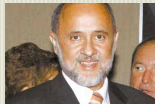
>> Deputado Hermínio Resende (PSL).