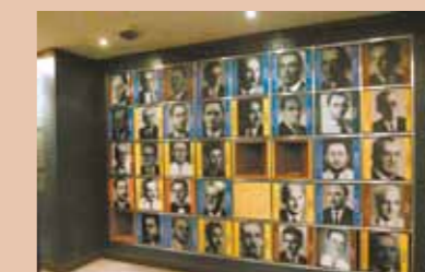
Painel dos Deputados da Constituinte de 1947

Também está exposta no Memorial Pontes Neto a réplica do livro das primeiras leis da Assembleia Legislativa do Ceará, de 1834. A obra original foi escrita por José Martiniano de Alencar, que na época era chefe do Executivo Provincial do Ceará. O Padre Alencar foi um grande exemplo da relação batina e política. O parlamentar foi pai de oito filhos, entre eles o escritor José de Alencar.