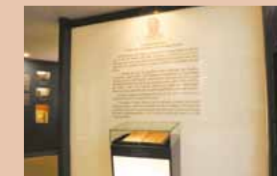
Livro das Primeiras leis da Assembleia Legislativa do Ceará

O acervo do Memorial Pontes Neto é organizado em ordem cronológica de acordo com os principais acontecimentos que marcaram a História do Brasil e do Ceará. Por isso, a visita pelo Memorial começa relatando o Descobrimento do Brasil e a chegada da família real portuguesa. Para compor o cenário, o espaço traz uma réplica em gesso do brasão dos Orléans e Bragança.