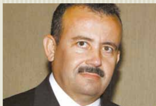
>> Deputado Neto Nunes (PMDB).