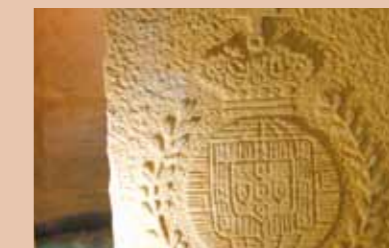
Brasão da Família Real

U m dos mais modernos memoriais da América do Sul, o Pontes Neto mostra, com inovação tecnológica e muita dinamização, os principais acontecimentos políticos e os ilustres personagens que fizeram e ainda fazem parte da História do Brasil e do Ceará.