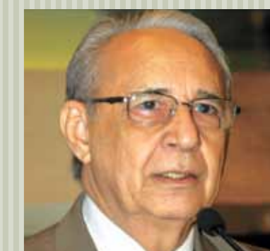
>> Deputado Guaracy Aguiar (PRB)