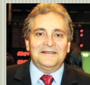
>> Deputado Luiz Pontes (PSDB)