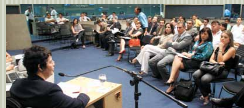
>> Participantes do Encontro assistem à palestra