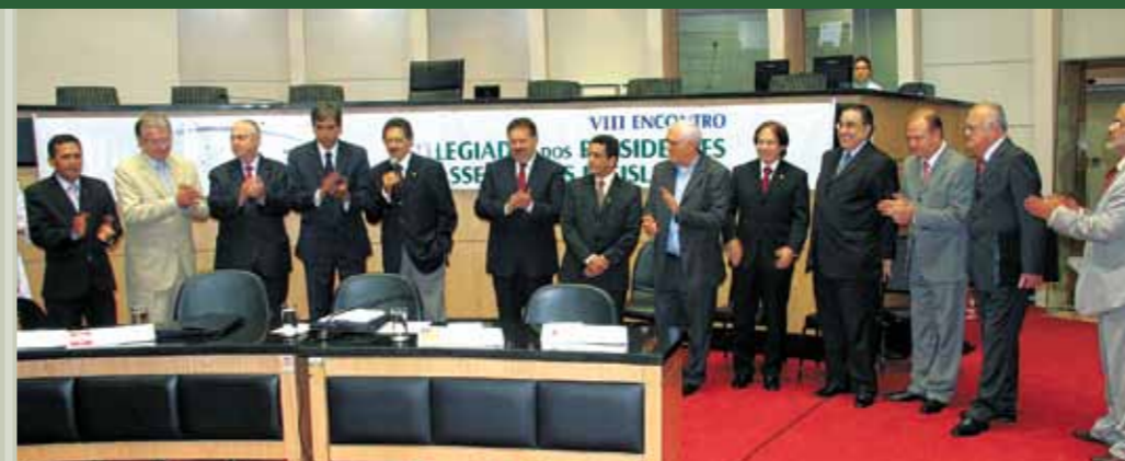
>> Domingos Filho (PMDB) é aclamado presidente do Colegiado das Assembleias Legislativas do Brasil