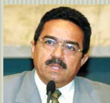
>> Deputado Augustinho Moreira (PV)