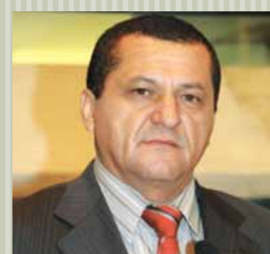
>> Deputado Dedé Teixeira (PT)