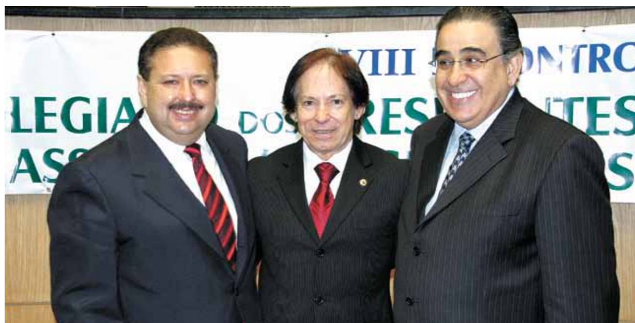
>> Presidente eleito do colegiado, deputado Domingos Filho (PMDB-CE), presidente da Unale, deputado Clóvis Ferraz (BA) e atual presidente do Colegiado, deputado Alberto Pinto Coelho (PP-MG).

Domingos Filho afirmou que, à frente da entidade, vai intensificar o compartilhamento de experiências entre as Assembleias brasileiras, dando continuidade a um trabalho iniciado pelo atual presidente Alberto Pinto Coelho (MG).