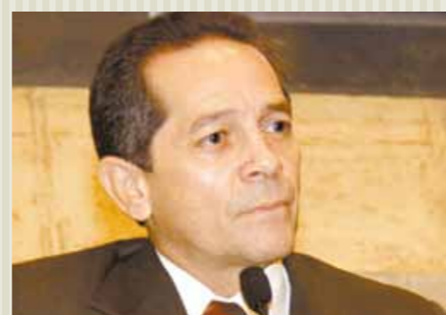
>> Deputado Heitor Férrer (PDT)