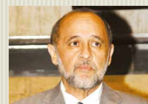
>> Deputado Hermínio Resende (PSL)