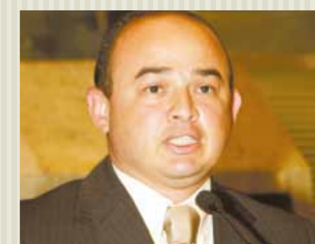
>> Deputado Sérgio Aguiar (PSB)