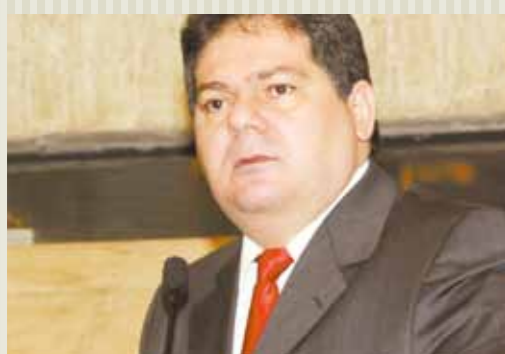
>> Deputado Osmar Baquit (PSDB)