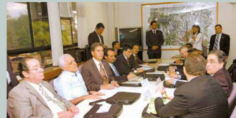
>> Presidentes das Assembleias reunidos em Brasília escolhem novo presidente da entidade

O colegiado pediu também a ampliação da prerrogativa de legislar sobre transportes, assuntos agrários, licitações, diretrizes educacionais, etc. A ideia