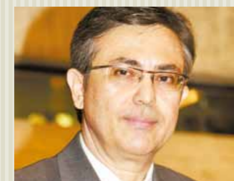
>> Deputado Adahil Barreto (PR).