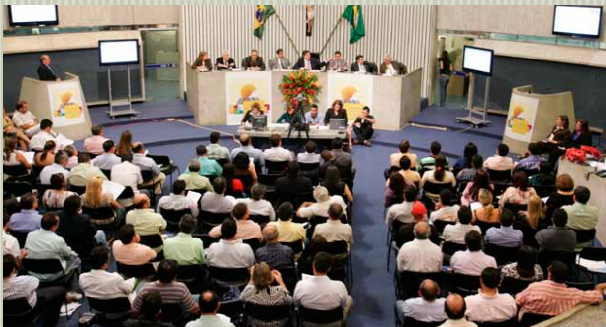
>> Presidente Domingos Filho (PMDB) apresenta aos vereadores os programas da Unilece no I Silegis.

A Assembléia Legislativa reuniu 94 presidentes de câmaras municipais cearenses no I Seminário de Integração Legislativa (Silegis). O presidente Domingos Filho (PMDB) pôs à disposição dos legislativos, os programas da União Interativa do Legislativo Cearense (Unilece). O plenário sediou também: a reunião do Parlamento Nordestino com a presença do ministro Roberto Mangabeira Unger; sessão solene em homenagem ao desembargador Fernando Ximenes; e premiação do II Concurso Jornais Escolares Contra a Desertificação, promovido pelo Inesp.