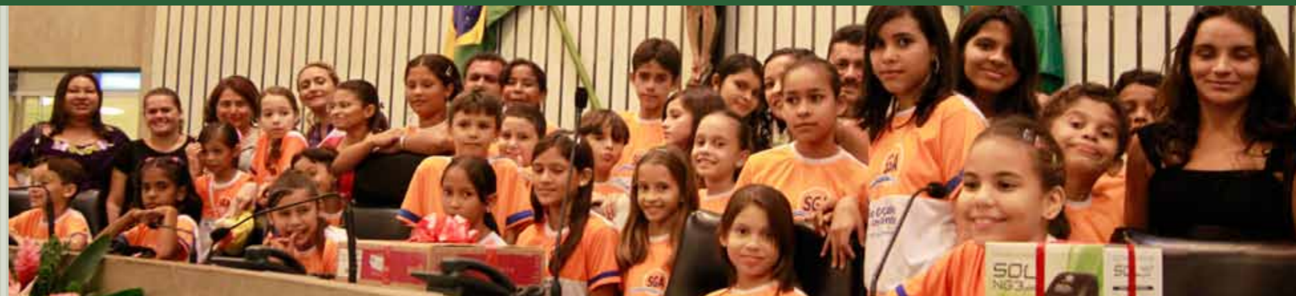
>> Alunos da rede pública na premiação do II Concurso de Jornais Escolares contra a Desertificação.