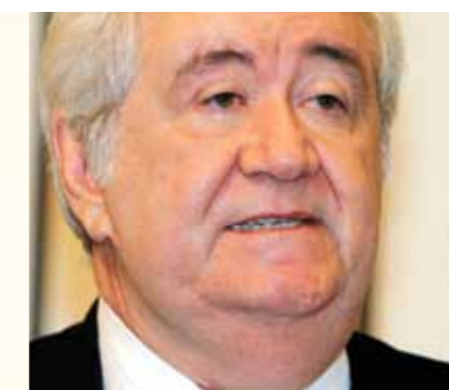
>> Deputado Moésio Loiola (PSDB), presidente da Comissão de Defesa do Consumidor

O Projeto Interlece apresentou quatro pareceres jurídicos respondendo a consultas de vereadores e duas consultas sobre modelos de proposições para câmaras municipais. O Municipalidade disponibilizou o quadro político dos 184 municípios cearenses, bem como, fotos de prédios públicos de municípios e informações sobre vereadores.