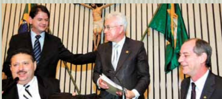
>> Presidente Domingos Filho (PMDB), governador Cid Gomes, ministro Mangabeira Unger e deputado federal Ciro Gomes, em seminário sobre o Nordeste.

A Assembléia Legislativa reuniu 94 presidentes de câmaras municipais cearenses no I Seminário de Integração Legislativa (Silegis). O presidente Domingos Filho (PMDB) pôs à disposição dos legislativos, os programas da União Interativa do Legislativo Cearense (Unilece). O plenário sediou também: a reunião do Parlamento Nordestino com a presença do ministro Roberto Mangabeira Unger; sessão solene em homenagem ao desembargador Fernando Ximenes; e premiação do II Concurso Jornais Escolares Contra a Desertificação, promovido pelo Inesp.