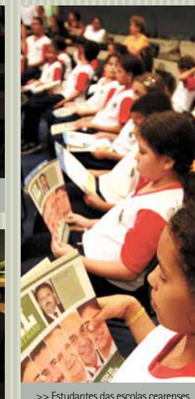
>> Estudantes das escolas cearenses lêem o jornal AL Notícias no Plenário 13 de Maio.