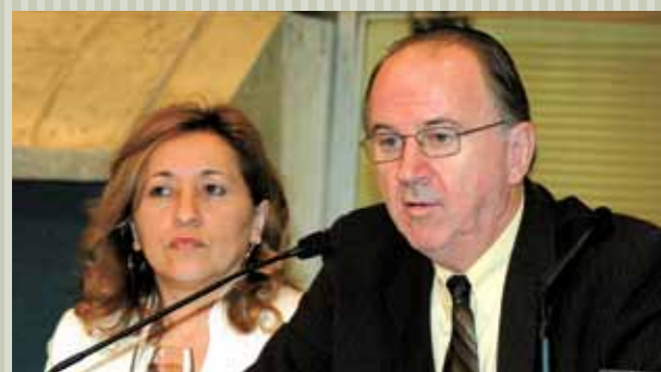
>> Presidente da Aprece, Eliene Brasileiro e o presidente da Confederação Nacional dos Municípios, Paulo Ziulkoski.