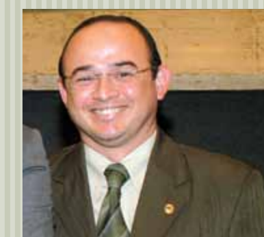
>> Deputado Sérgio Aguiar (PSB)