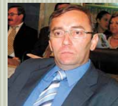
>> Deputado Nenen Coelho (PSDB)