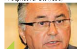
>>>Dep. Idemar Citó (PSDB)

Projeto de lei elaborado e apresentado pelo deputado Idemar Citó (PSDB), está tramitando e aguardando votação na Assembléia Legislativa do Estado do Ceará. A matéria propõe que sejam instaladas válvulas eliminadoras de ar nas tubulações de água, junto aos hidrômetros da Companhia de Água e Esgotos do Estado do Ceará (Cagece). Os aparelhos, quando instalados nos hidrômetros, servirão para evitar que o ar seja registrado e contabilizado como se fosse consumo de água nos medidores. A matéria encontra-se atualmente em tramitação nas Comissões Técnicas.