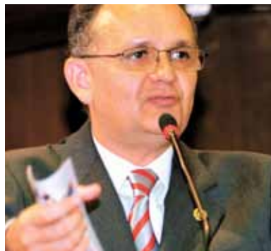
>>>Deputado Francisco Caminha (PHS), presidente da Universidade do Parlamento

Segundo o presidente da Universidade do Parlamento, deputado Francisco Caminha (PHS), "o foco da entidade será o fortalecimento do ensino à distância – a chamada educação interativa". Assim, ele explica, a participação de moradores do Interior será facilitada "Isso para que todos os cidadãos dos municípios e distritos mais distantes possam entender como são feitas as