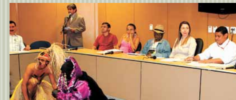
>> Audiência pública comemorativa aos 125 anos da abolição dos escravos no Ceará.