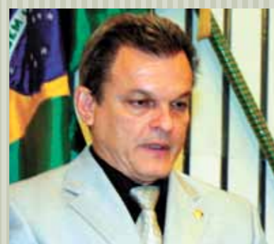
>> Deputado José Sarto (PSB)