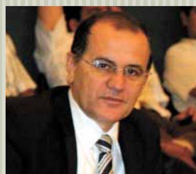
>> Deputado Antônio Granja (PSB)