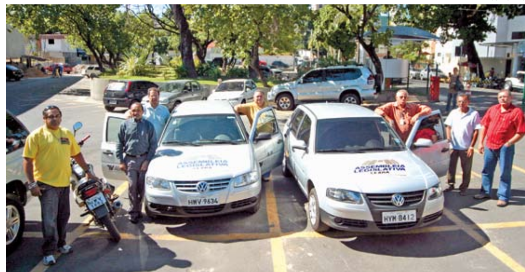
>> Motoristas da AL transportam servidores e deputados com segurança e responsabilidade