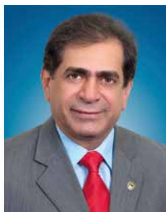
>> Deputado Zezinho Albuquerque Presidente da Assembleia Legislativa do Estado do Ceará

Cumprindo o princípio da harmonia entre os poderes, a Assembleia exerce seu papel de acompanhamento das ações do Executivo, por meio do Ciclo de Visitas dos secretários à Casa do Povo. Nós idealizamos esse projeto para conhecer as medidas em favor dos cearenses e fortalecer os laços com o Governo na busca de soluções. Em novembro, recebemos dois secretários e tratamos das medidas de combate aos efeitos da prolongada estiagem e as providências na área de segurança pública para diminuir a violência.