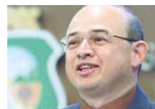
>>Sérgio Aguiar (Pros)

O projeto de lei 238/15, do deputado Sérgio Aguiar (Pros), em apreciação na AL, determina a obrigatoriedade da divulgação pelos postos de combustíveis, da informação sobre a certificação de qualidade emitida pela Agência Nacional do Petróleo (ANP) para os produtos derivados do petróleo e as fontes alternativas de combustível. A proposta estabelece que a informação da certificação deve ser afixada em local acessível ao consumidor e que os postos que comercializarem combustível adulterado ficarão sujeitos às sanções e penalidades previstas na Lei nº 9.847/99.