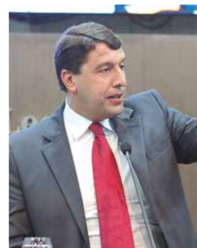
>>Deputado Gony Arruda (PSD)