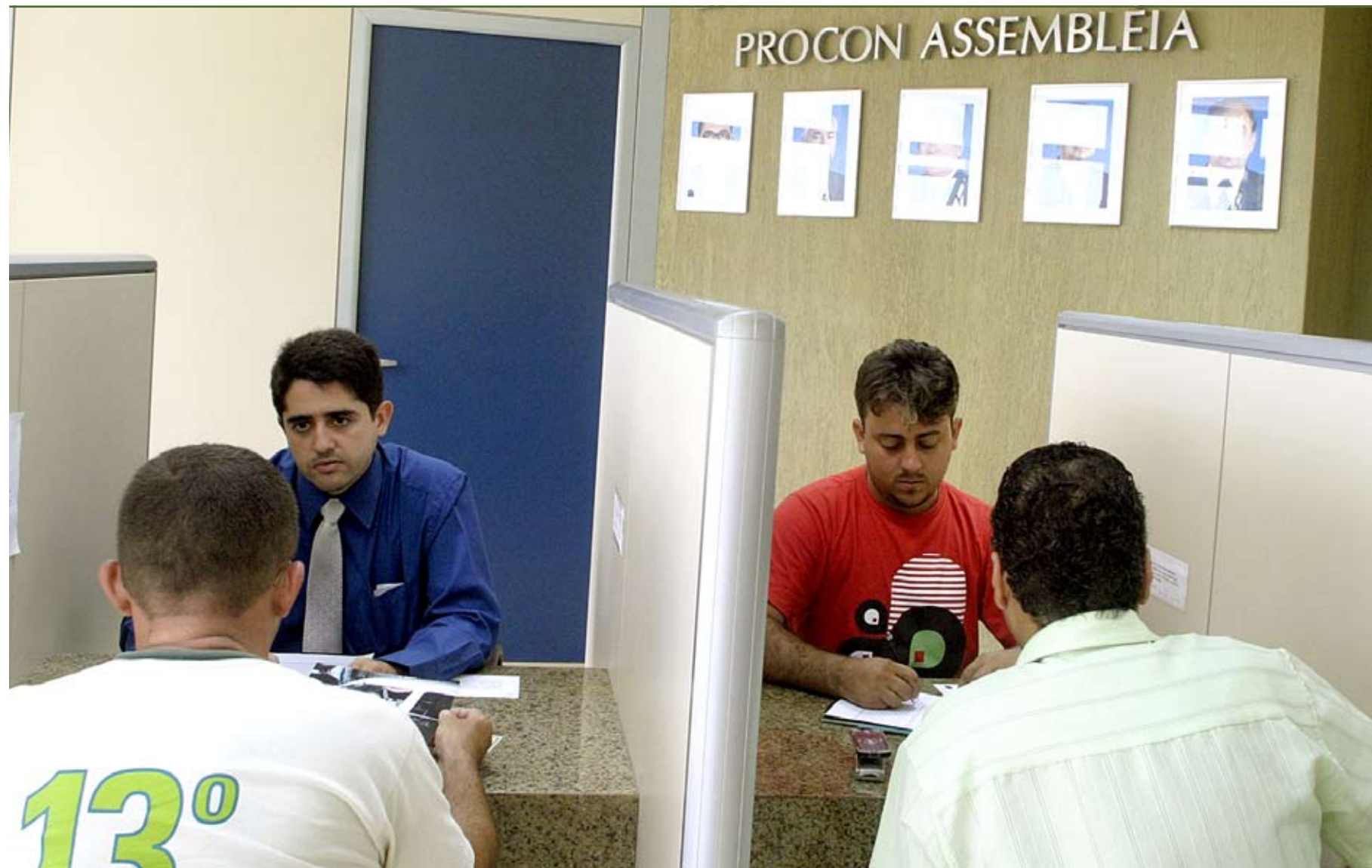
>> Atendimentos do Procon triplicaram em quatro anos