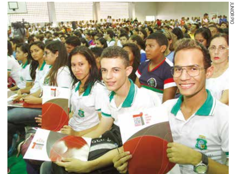
Estudantes em seminário Ceará sem Drogas, no Crato.