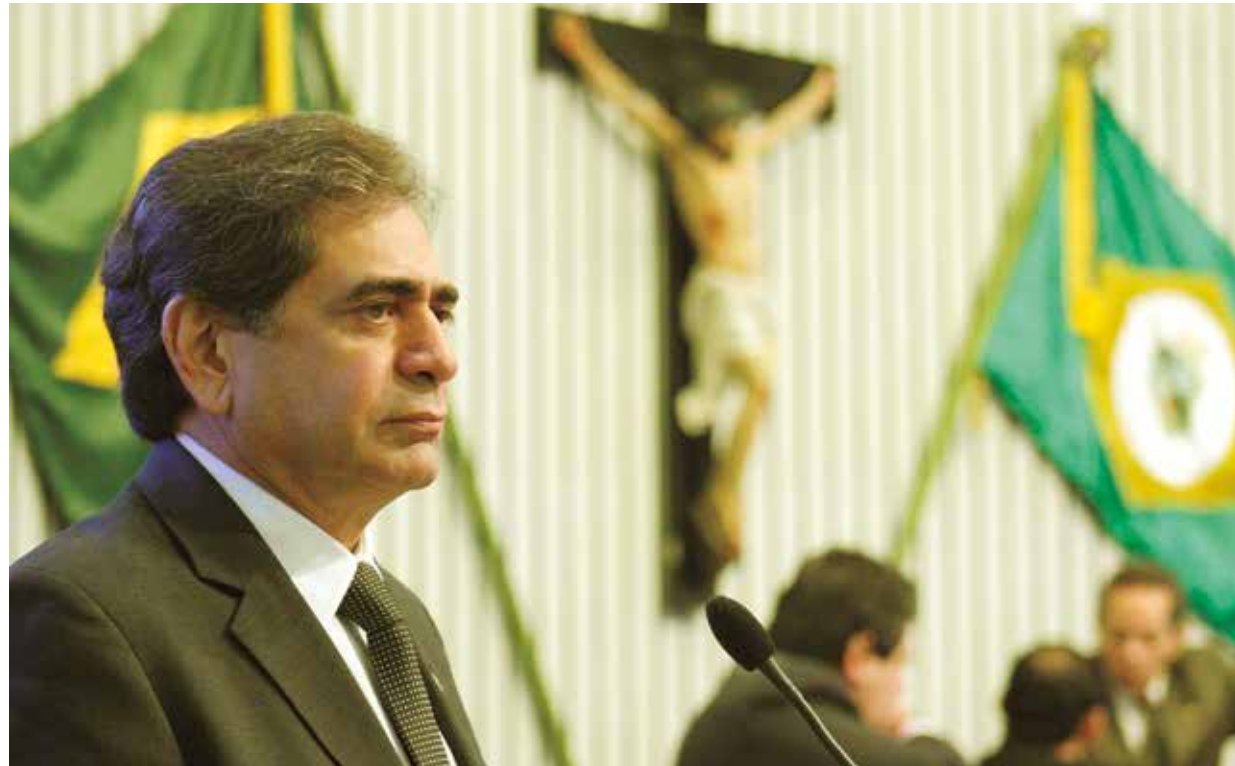
>>Presidente Zezinho Albuquerque (Pros) avalia, em pronunciamento no Plenário, trabalho legislativo da Casa.

O presidente da Assembleia, deputado Zezinho Albuquerque (Pros) ao avaliar o trabalho legislativo da Casa, destacou que as votações realizadas no plenário beneficiaram diversos setores da sociedade. Entre essas votações, ele apontou a aprovação da isonomia dos servidores do Tribunal de Justiça e da Procuradoria de Justiça do Estado. Citou também o compromisso dos deputados com as grandes demandas da população que chegam a Assembleia e agradeceu o apoio dos órgãos de comunicação e os diretores da Casa na divulgação das atividades, o que garante a transparência dos atos e maior interação entre o cidadão e o Poder.