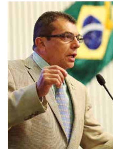
>> Deputado Ely Aguiar (PSDC)