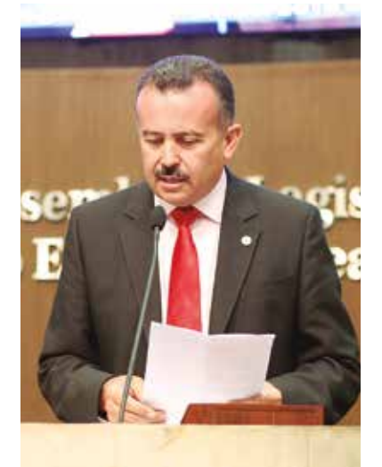
>>Deputado Neto Nunes (PMDB)