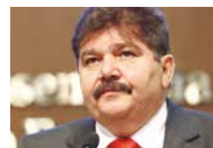
>> Wellington Landim (Pros)

O número de ciclistas cresce a cada dia. A prática, além de saudável, reduz a poluição e facilita a mobilidade. Tanto assim, que hoje os planos de mobilidade urbana estão contemplando as faixas de ciclistas nas vias. Sintetizado com a questão, o deputado Wellington Landim (Pros) propõe, por meio do projeto de lei 14/2014, em apreciação na Assembleia Legislativa, a criação da Semana Estadual de Conscientização do Motorista aos Direitos do Ciclista. O evento deve acontecer anualmente, na semana que compreende o dia 25 de setembro, Dia Nacional do Trânsito.