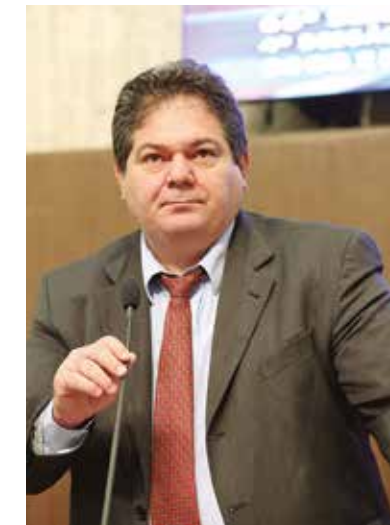
>> Deputado Osmar Baquit (PSD)