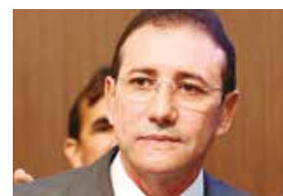
>> Deputado Adail Carneiro (PHS)

A implantação da tecnologia de body scanners para revista eletrônica nos presídios e proibição da revista íntima nos estabelecimentos prisionais pode virar lei no Estado. Projeto de Indicação 79/14, proposto pelo deputado Adail Carneiro (PHS), em apreciação no Poder Legislativo, estabelece que todo visitante que ingressar nos estabelecimentos penais do Estado do Ceará será submetido à revista eletrônica. A propositura também obriga todos os agentes penitenciários e funcionários das unidades prisionais do Estado do Ceará a se submeterem a revista eletrônica.