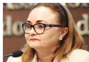
>> Eliane Novais (PSB)

A criação de um Campus Universitário Modelo na unidade prisional Instituto Penal Professor Olavo Oliveira 2, em Itatinga (CE) foi proposta pela deputada Eliane Novais (PSB), por meio do projeto de indicação 156/13, aprovado na Assembleia Legislativa. A propositura tem como finalidade habilitar detentos para o mercado de trabalho e prepará-los para o retorno ao convívio social. O projeto estabelece que na construção da estrutura física do Campus seja utilizada a mão de obra dos detentos, sendo asseguradas a remuneração e a redução da pena conforme prevê a Lei de Execução Penal.