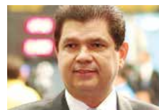
>> Mauro Filho (Pros)

Proposta de Emenda Constitucional nº 04/14, em apreciação na Assembleia Legislativa, garante a dispensa de alvarás ou documentos que autorizem o funcionamento de cultos religiosos ou igrejas. O projeto é de autoria do deputado Mauro Filho (Pros) e estabelece ainda que para o exercício de atividades religiosas, fica instituído o regime de autorregulação por entidades representativas dos segmentos religiosos, credenciadas pelo Poder Público municipal, de forma que se garantam as perfeitas condições de segurança e harmoniosa convivência com os demais segmentos da sociedade.