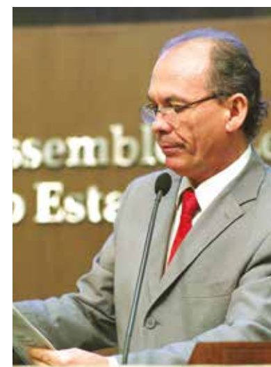
>>Deputado Nelson Martins (PT)