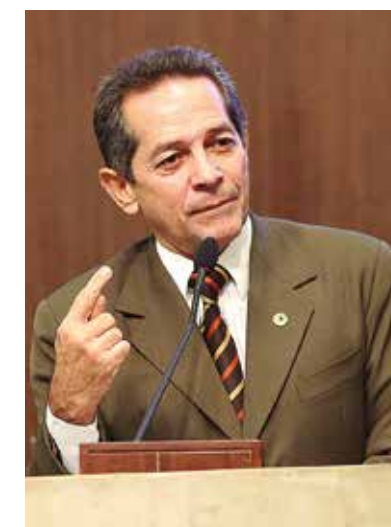
>>Deputado Heitor Férrer (PDT)