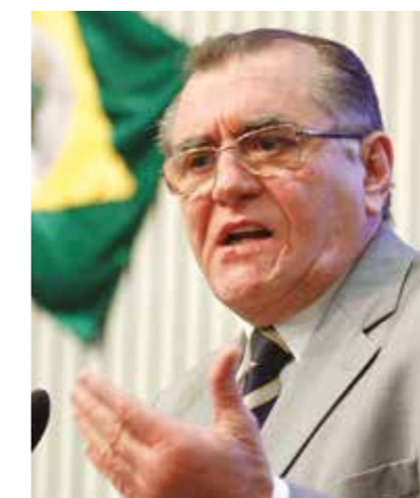
>> Deputado Lucílvio Girão