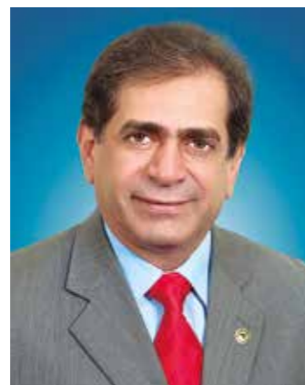
>> Deputado José Albuquerque Presidente da Assembleia Legislativa do Estado do Ceará

A busca pela popularização de energias renováveis em moradias de baixa renda foi mais um passo dado pela Assembleia Legislativa no cumprimento do projeto A3P – AL Sustentável. É um desafio a ser enfrentado e foi discutido em agosto na Comissão de Desenvolvimento Regional, Recursos Hídricos, Minas e Pesca com representantes da Adece e Aneel. Neste semestre, prosseguimos a campanha de mobilização pela imediata implantação da Refinaria Premium do Ceará. Visitamos municípios sedes de macrorregiões e vimos o envolvimento da sociedade civil ao reconhecer a importância da obra. Até o final, teremos percorrido 11 municípios e conversado com lideranças de todas as cidades do Ceará. Encerraremos a campanha com um grande encontro em Fortaleza.