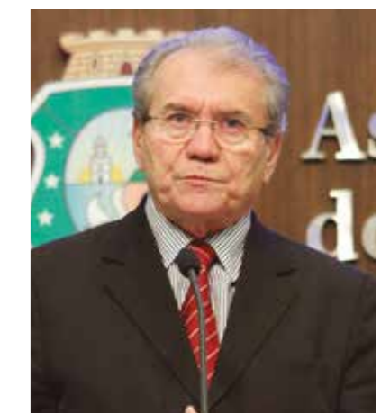
>> Deputado Vasques Landim