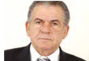
>> Rogério Aguiar (PSD)

A entrada de sinalizadores em estádios de futebol localizados no Ceará pode estar com seus dias contados. Projeto de lei aprovado na Assembleia Legislativa, de autoria do deputado Rogério Aguiar (PSD), proíbe os sinalizadores em eventos desportivos e shows em ambientes fechados. O projeto inclui ainda a proibição de canetas laser, que podem causar lesões no globo ocular, provocando problemas como a cegueira. No caso de descumprimento da lei, o infrator poderá ser alvo de advertência ou no pagamento de multa cujo valor poderá variar de R$ 1.000 a R$ 10.000.