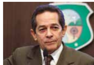
>> Heitor Férrer (PDT)

Projeto de lei 04/2013, de autoria do deputado Heitor Férrer (PDT), em tramitação na Assembleia Legislativa, quer proibir, no âmbito da administração estadual dos poderes Executivo, Legislativo e Judiciário, Ministério Público Estadual e tribunais de contas, a utilização de recursos públicos para patrocinar eventos sejam eles festivos, esportivos ou religiosos, relacionados à inauguração de obras públicas ou assinatura da ordem de serviço. Ele ressalta que diante da ausência de recursos para várias áreas vitais de interesse do povo, não se justifica o emprego de verbas públicas para esse fim.