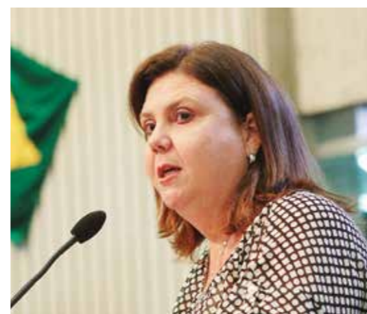
>> Deputada Fernanda Pessoa (PR)