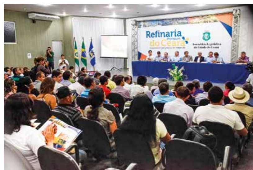
Seminário sobre a Refinaria Premium do Ceará em Limoeiro do Norte.

O presidente da AL disse que a campanha tem sido muito bem recebida em todas as visitas ao Interior. Ele destacou o envolvimento dos prefeitos, câmaras, entidades e demais segmentos da sociedade civil dos municípios das macrorregiões visitadas. E agradeceu a mobilização dos prefeitos municipais. “Estamos mostrando e a população está entendendo qual a