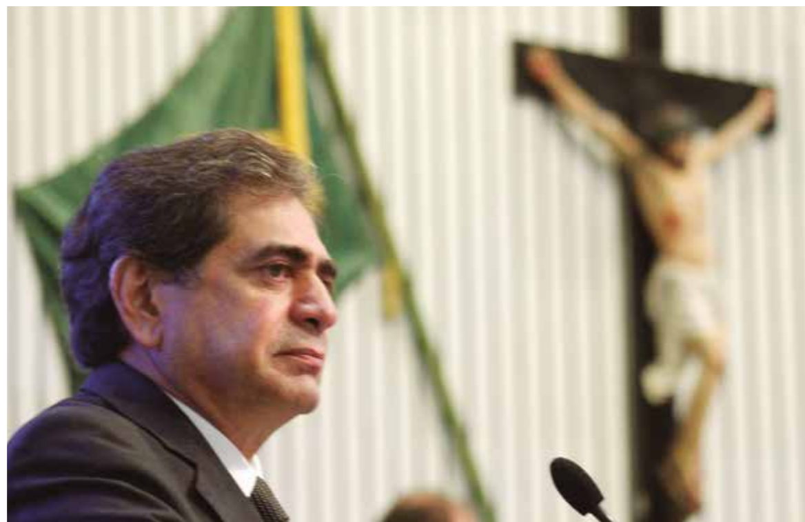
>>Presidente José Albuquerque (PSB) apresenta o balanço do semestre ao Plenário.

O presidente da Assembleia, deputado José Albuquerque (PSB), fez o balanço das atividades do primeiro semestre de 2013 no Plenário da Casa. Ele renovou “os compromissos com a continuidade de um Parlamento forte, produtivo, responsivo às demandas e às necessidades da sociedade civil cearense” e agradeceu aos parlamentares, pelo compromisso e lealdade aos interesses do povo e pelo apoio dado à Mesa Diretora. Albuquerque enfatizou as atividades das Comissões Técnicas que realizaram 106 reuniões ordinárias, 73 extraordinárias e 91 audiências públicas, 15 seminários e 106 reuniões externas nesse semestre. No período, foram apresentados 463 projetos, dos quais 222 foram deliberados. O parlamentar também destacou a atuação dos diversos órgãos da Casa que prestam serviços à população.