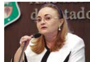
>> Eliane Novais (PSB)

A implantação de unidades geriátricas nas instituições hospitalares da rede pública estadual foi proposta pela deputada Eliane Novais (PSB). O projeto de indicação 10/2013, que está em tramitação no Legislativo, tem por objetivo garantir atendimento especializado ao idoso na rede pública. Pela proposta, as unidades geriátricas deverão manter pessoal especializado em geriatria e gerontologia social como estabelece a Lei Federal Nº 10.741/2003, o Estatuto do Idoso, proporcionando aos idosos, acompanhamento profissional e auxiliando-os no processo de envelhecimento.