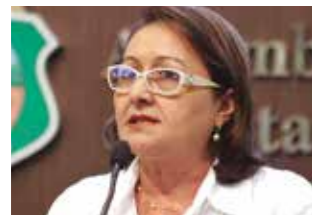
>> Mirian Sobreira (PSB)

A deputada Mirian Sobreira (PSB), propôs por meio de projeto de lei 147/2013 em apreciação no Legislativo, a proibição da atuação no Ceará de médicos que não sejam registrados no Conselho Regional de Medicina. O projeto determina ainda que o registro profissional de médicos formados no exterior seja expedido pelo Conselho Regional de Medicina mediante prova de conhecimento realizada por instituição de ensino superior reconhecida pelo Ministério da Educação ou aprovação no Exame Nacional de Revalidação de Diplomas Médicos-Revalida.