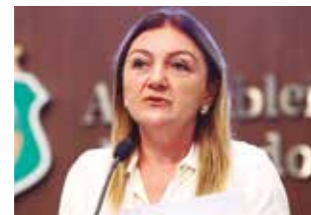
>> Inês Arruda (PMDB)

A criação no Estado do programa Estadual de Conscientização sobre a Hipertensão Arterial Precoce foi proposto por meio de projeto de lei 88/12 aprovado na Assembleia Legislativa, apresentado pela deputada Inês Arruda (PMDB). De acordo com pesquisa divulgada pelo Ministério da Saúde (MS), Fortaleza é a segunda capital brasileira com maior percentual de adultos com excesso de peso, que é fator de risco para as Doenças Crônicas Não Transmissíveis (DCNT), entre elas a hipertensão, responsáveis por 59% dos óbitos no mundo.