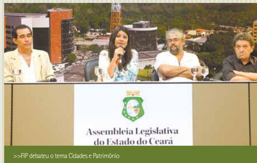
&gt;&gt;FIP debateu o tema Cidades e Patrimônio