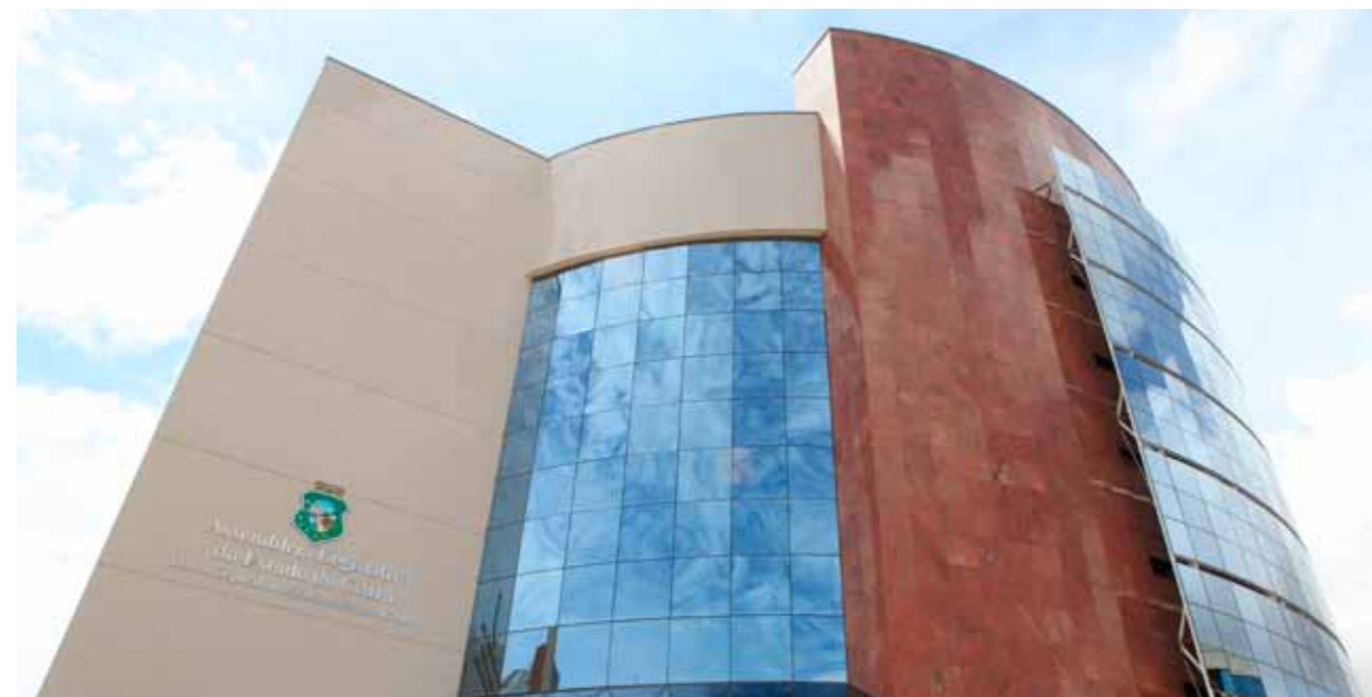
>> Fachada do novo prédio onde funciona agora a Universidade do Parlamento Cearense.

Projeto vai tornar alunos das escolas públicas aptos a concorrerem com os das instituições privadas.