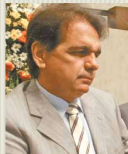
&gt;&gt; Perboyre Diógenes