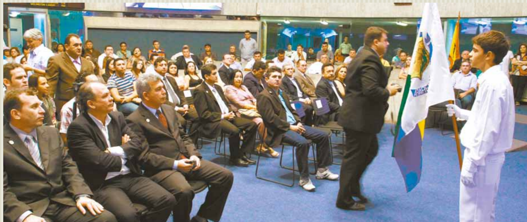
&gt;&gt; Deputados participam da primeira sessão de 2012