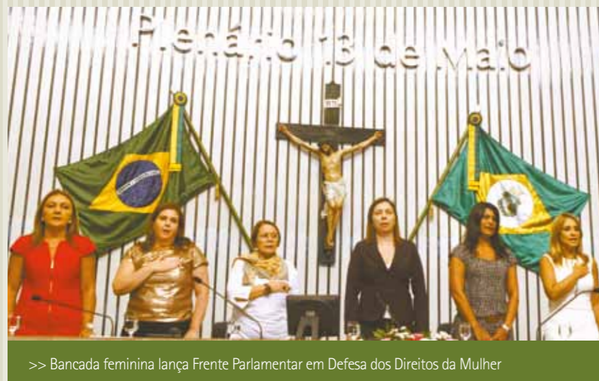
&gt;&gt; Bancada feminina lança Frente Parlamentar em Defesa dos Direitos da Mulher

Os debates do Fórum de Idéias Inovadoras em Políticas Públicas (FIP) e a Jornada Municipalista voltaram com força total à pauta dos eventos da Assembleia, no final de fevereiro. Em 8 de março, as deputadas estaduais se destacaram ao lançar a Frente Parlamentar de Defesa dos Direitos da Mulher.