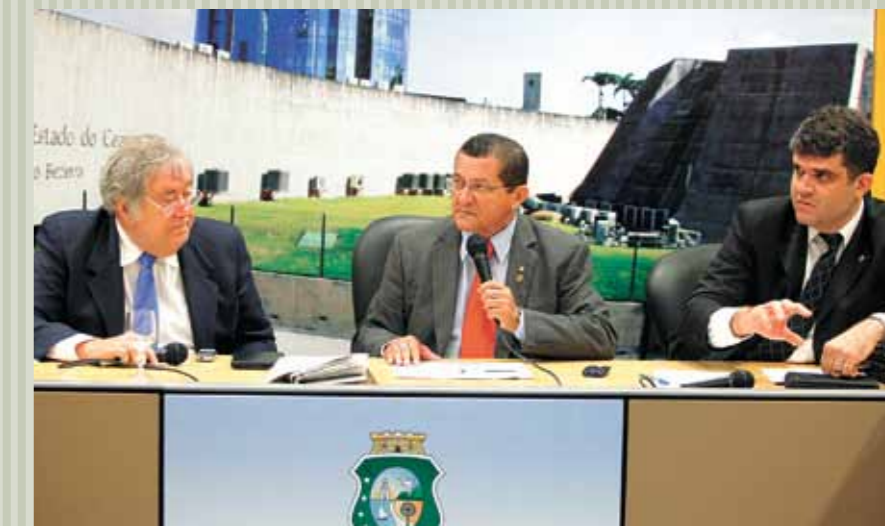
&gt;&gt; Reunião da Comissão de Fiscalização e Controle