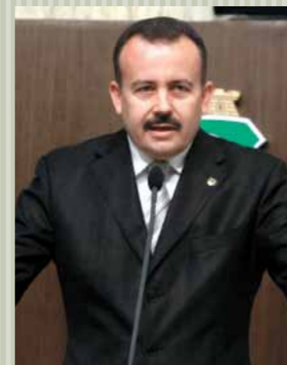
&gt;&gt; Deputado Neto Nunes (PMDB)