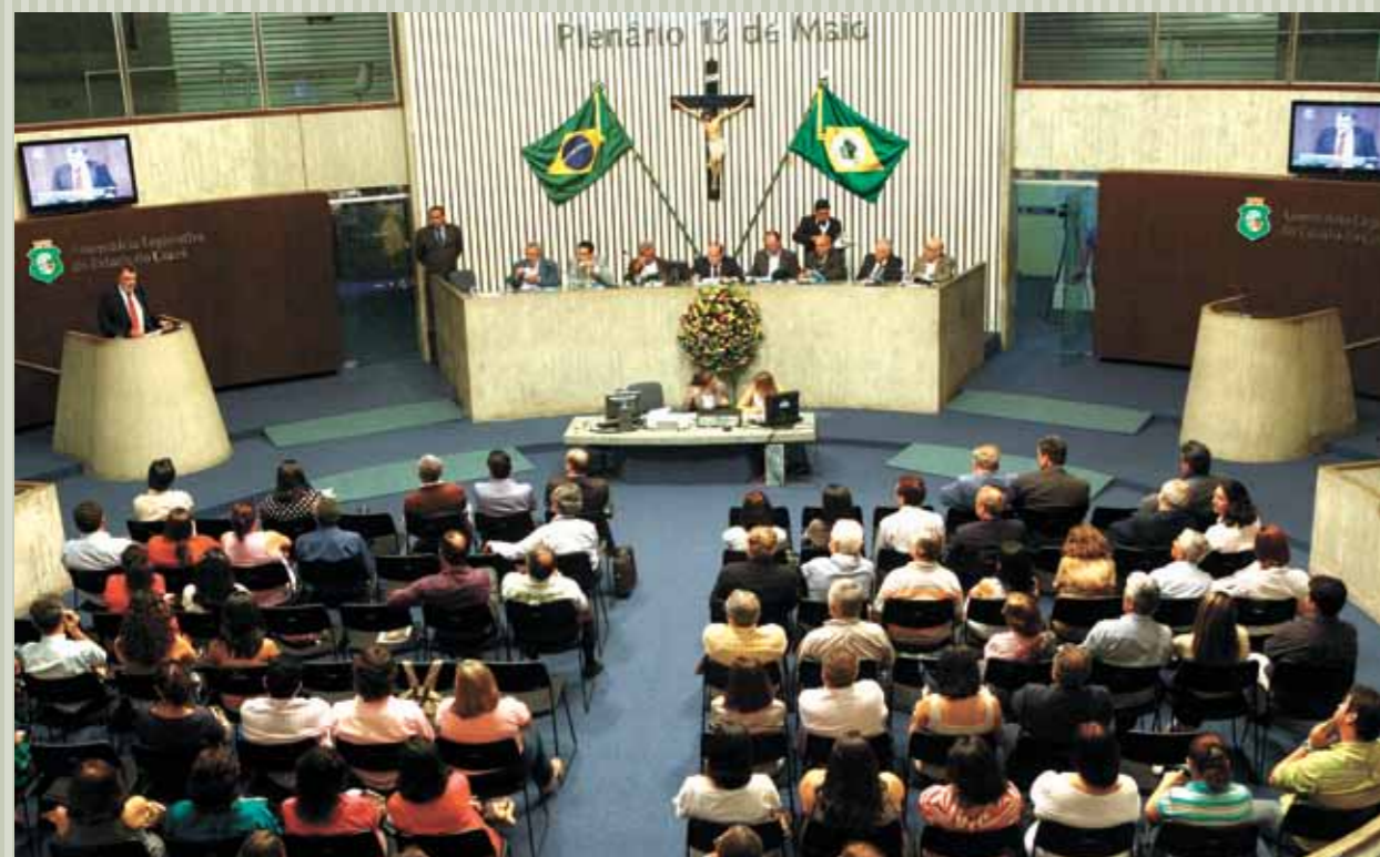
&gt;&gt; Parlamentares e convidados participam de eventos no Plenário 13 de Maio