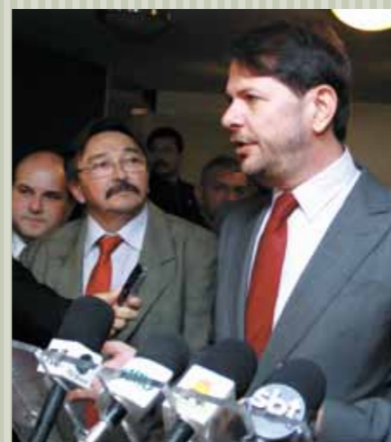
&gt;&gt; Cid concede entrevista coletiva à imprensa