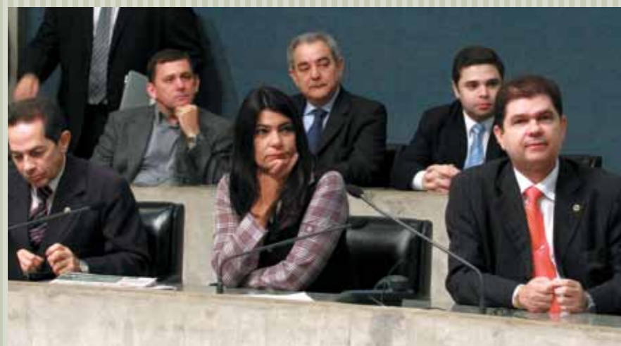
&gt;&gt; Deputados e secretários estaduais acompanham apresentação do governador

Palco dos debates de matérias, o Plenário 13 de Maio também é um espaço para receber autoridades. No último dia 7, o governador Cid Gomes ocupou a tribuna para apresentar as obras do Metrô de Fortaleza. O Plenário foi utilizado para o lançamento da publicação "Bases para Formulação de Política Estadual de Convivência com o Semiárido Cearense", do Conselho de Altos Estudos. Funcionários da Petrobras debateram com deputados sobre a camada pré-sal. No Complexo das Comissões, auditórios ganham novo visual.