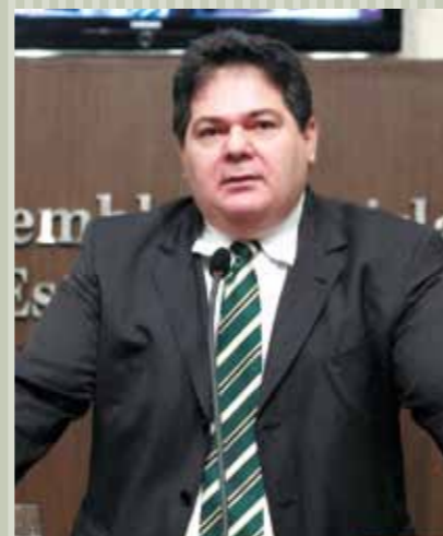
&gt;&gt; Deputado Osmar Baquit (PSD)