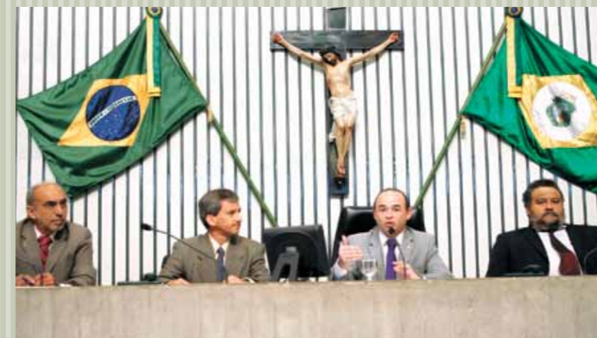
&gt;&gt; AL e Petrobras discutem camada pré-sal