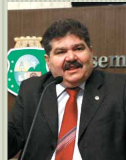
&gt;&gt; Deputado Wellington Landim (PSB)