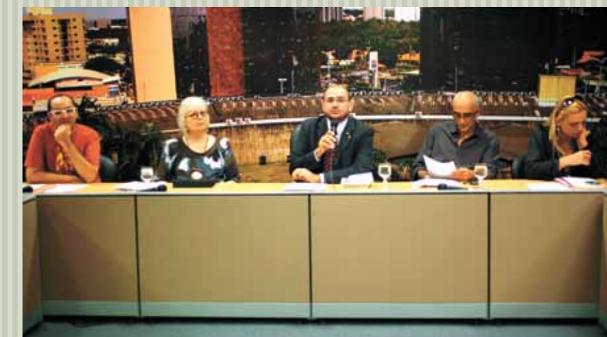
&gt;&gt; Fórum de Ideias Inovadoras em Políticas Públicas no Complexo das Comissões