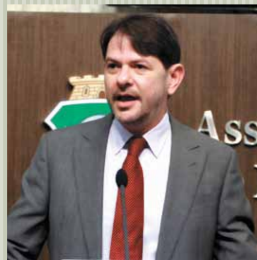
&gt;&gt; Cid apresenta obras do Metrô de Fortaleza