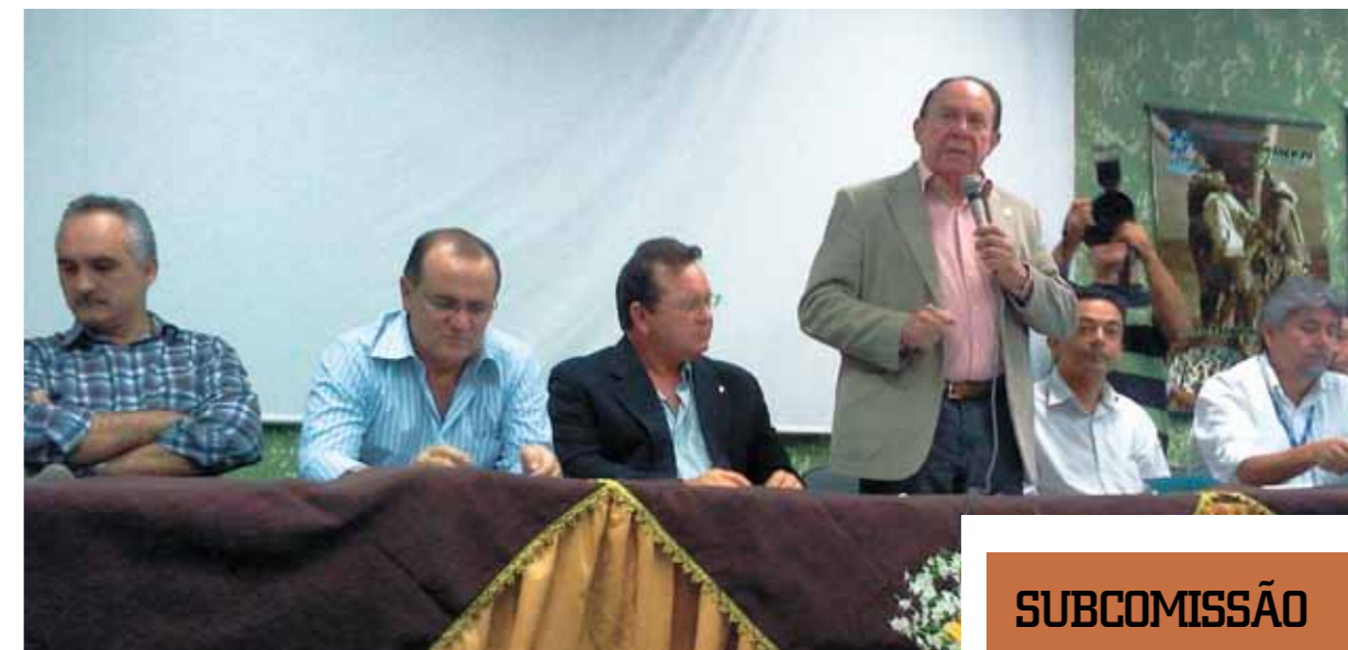
>>>Subcomissão discute cajucultura durante audiência em Itapipoca

A Subcomissão do Caju foi instalada no dia 29 de setembro deste ano. O colegiado foi criado para tratar de assuntos inerentes à cultura do caju no Estado. A subcomissão